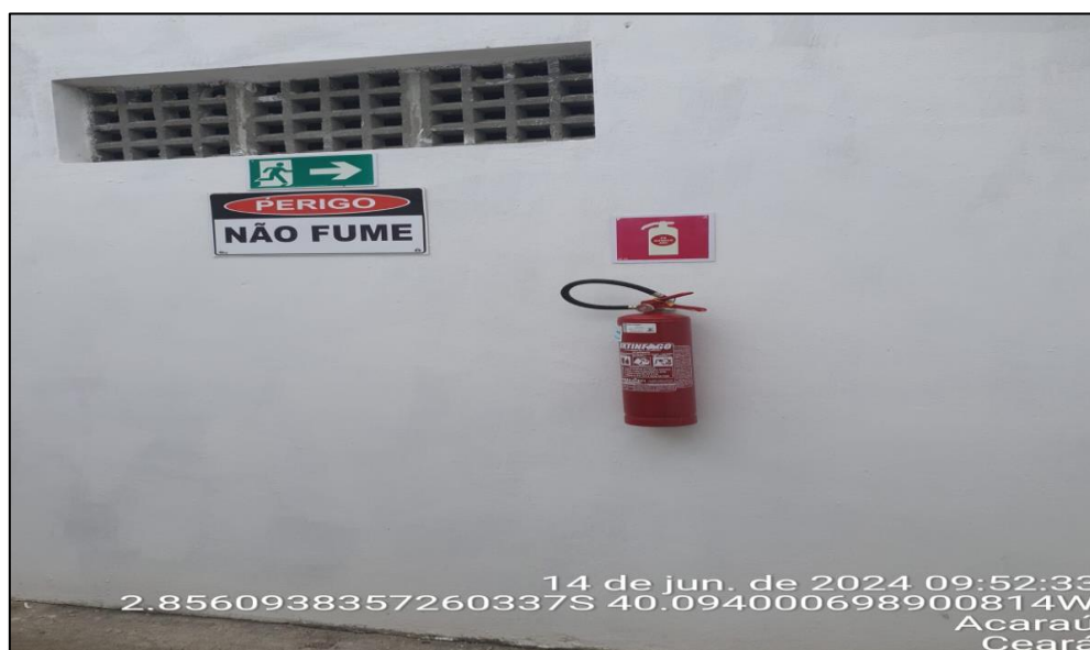
Figura 03: Extintor e placas de sinalização.