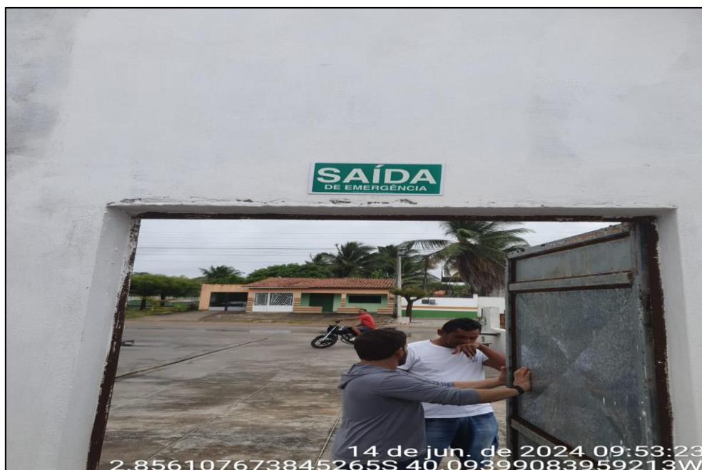
Figura 02: Saída de emergência.