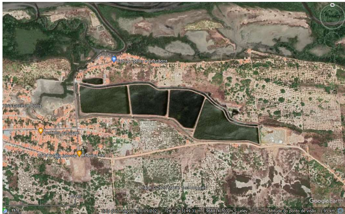
Figura 01: Imagem de satélite, software Google Earth.