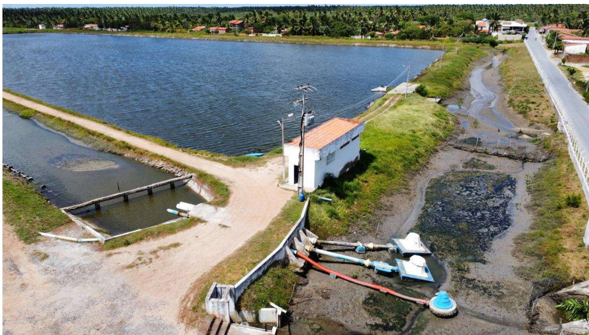
Figura 03: Bombas e abastecimento.